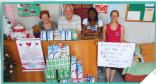
Ação Social: doação de leite ao CACC