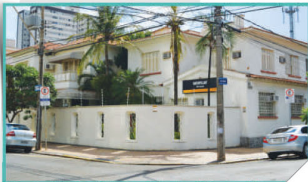
Sede localizada no prédio da Caterpillar-Vila Saúde em Piracicaba