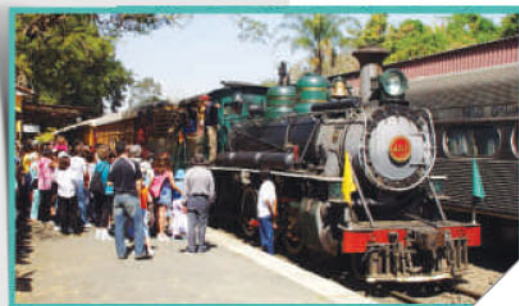
Passeio de Maria Fumaça em Jaguariúna

Em 21 de março realizou-se a reunião conjunta do 1º Semestre, no local de sua nova sede, utilizando as dependências do auditório da Vila Saúde. Em 25 de abril foram realizadas AGO e Confraternização na Wienke Educacional. Em maio foi promovido agradável passeio, ensejando uma volta ao passado, com o percurso de trem Maria Fumaça de Campinas a Jaguariúna, seguido de visita e compras em Pedreira, a chamada Capital da Porcelana do Brasil, contando com a participação de 68 associados e familiares. No início de dezembro, com uma participação recorde, 359 pessoas, foi realizada a belíssima festa de confraternização de fim de ano, destacando-se o lançamento da Exposição "Memórias Caterpillar", com fotos, materiais e reportagens rememorando momentos e fatos importantes para os Associados em suas vidas na Caterpillar; mais uma vez, na ocasião, atendendo aos Estatutos, ocorreram tranquilas e democráticas eleições para o próximo biênio.