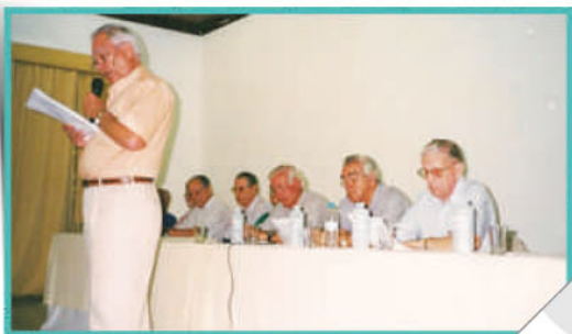
Evento comemorativo aos 10 anos da ABENCAT