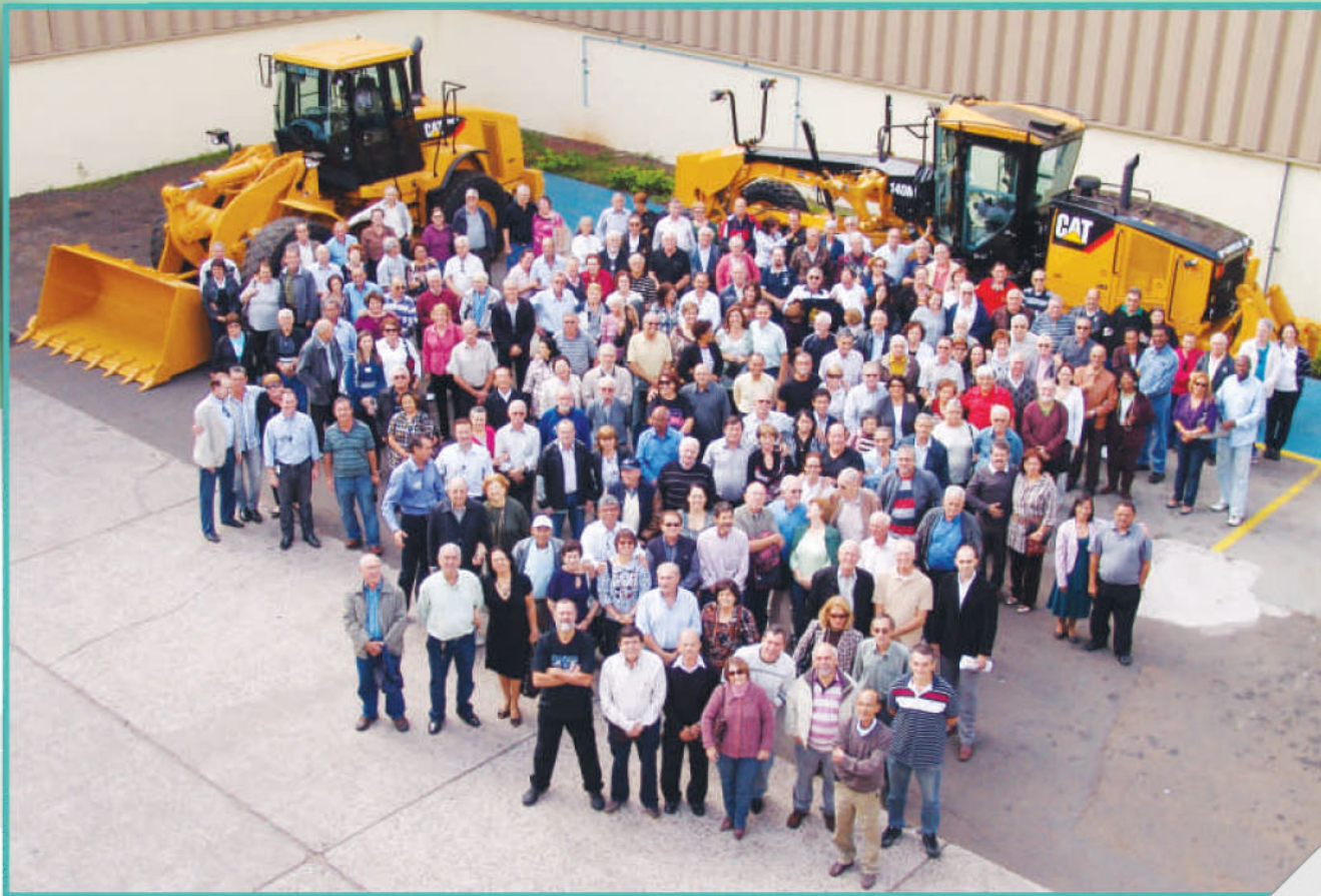
Visita dos associados da Abencat à Fábrica da CBL, em Piracicaba