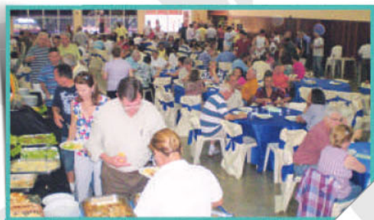
Festa de Confraternização no CEC