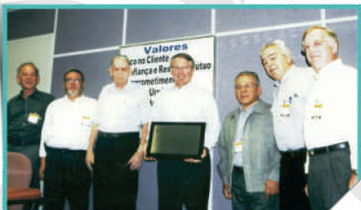
Visita a CBL nas comemorações de 50 anos da Caterpillar no Brasil