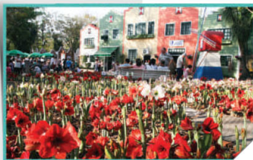
Passeio à Expoflora em Holambra

A AGO e confraternização foram realizadas na Wienke Educacional em maio. Em setembro foi realizada pela segunda vez excursão à Expoflora, em Holambra, com cerca de 50 associados de São Paulo e Piracicaba. No início de outubro realizada a reunião conjunta, Diretoria e Conselhos, na Wienke Educacional. E em dezembro, no CEC, foram realizadas as eleições para o próximo biênio, com participação de 198 votantes, durante o especial encontro de Confraternização de Fim de Ano. A ABENCAT fechou o ano com 272 associados, 20 novos associados ingressaram na Associação somente no mês de dezembro.