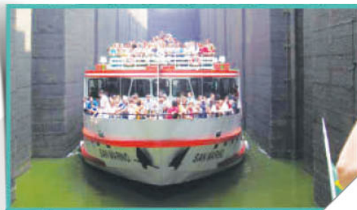
Excursão para Barra Bonita

Neste ano o Boletim "Abencat e Você" completava 10 anos, fechando o ano com 40 edições. A reunião conjunta foi realizada em 11 de abril nas dependências do CEC, destacando-se a discussão sobre novas alternativas de comunicação e renovação editorial e formatação do boletim. Em 21 de abril foi realizada a AGO e Confraternização, na Wienke Educacional. No início de julho, atendendo solicitação da Associação, a Caterpillar recebeu 148 associados para visita à Fábrica e show de máquinas na área de demonstração, culminada com um agradável almoço no repaginado restaurante da Empresa. Em setembro foi promovida excursão para Barra Bonita, com hospedagem em confortável hotel às margens da eclusa, incluindo passeio de barco, jantar dançante e outras diversões; 46 Associados de Piracicaba e São Paulo desfrutaram da promoção. No dia primeiro de dezembro foram realizadas no CEC as eleições para novos mandatos da Diretoria e Conselhos, com expressiva votação de 214 Associados, promovendo-se simultaneamente calorosa confraternização de fim de ano, com mais de 300 participantes. O quadro de Associados continuou na sua gradativa ascendência totalizando 310 aposentados.