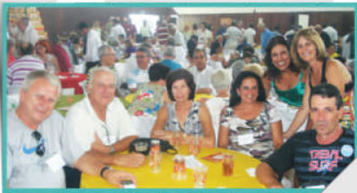
Festa de Confraternização no CEC