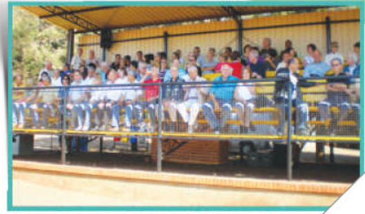
Visita à CBL, área de demonstração