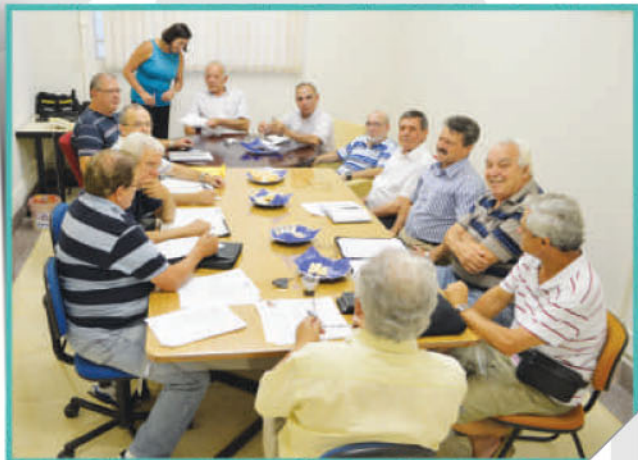
A diretoria da ABENCAT reunida na Sala de Reuniões do Vila Saúde

Mais uma vez, é necessário agradecer a todos os envolvidos naquela ocasião, para tornar esta aspiração da Associação em uma realidade.